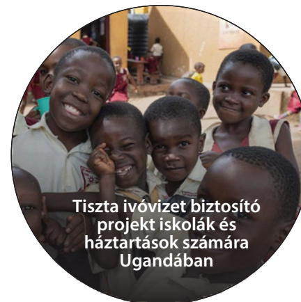
Tiszta ivóvizet biztosító projekt iskolák és háztartások számára Ugandában