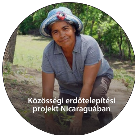
Közösségi erdőtelepítési projekt Nicaraguában

Fenntarthatósági programjának további előmozdítása érdekében az SKROSS® 2022-ben partnerségre lépett a neves svájci „myclimate” klímaalapítvánnyal. Az együttműködés alapja az összes szakmai tevékenység és alkalmazott ökológiai lábnyomának mérése. A mért elemek nem csak a megtett repülőutak és az autóval megtett kilométerek, hanem az épület fűtésére felhasznált energia is, többek között. A CO 2 -lábnyomukat kiszámítják és anyagilag kompenzálják a levegő CO 2 -tartalmát csökkentő nemzetközi klímavédelmi projektek támogatásával.