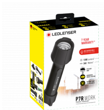
Példa illusztráció a csomagolásra