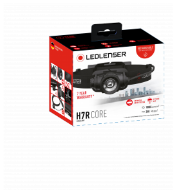
Példa illusztráció a csomagolásra